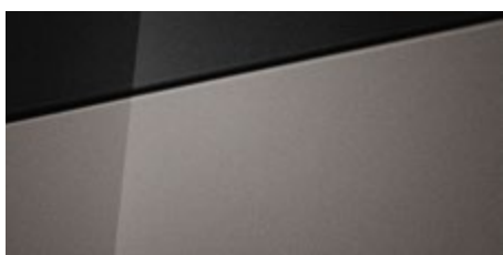
Brass (R3W - perłowy) Dostępny również z dachem w kolorze Phantom Black (5R3)