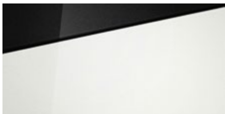
Polar White (PSW - bez dopłaty) Dostępny również z dachem w kolorze Phantom Black (5PS)