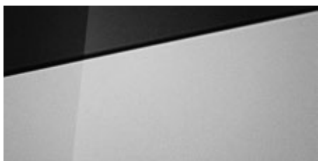
Sleek Silver (RYS - metaliczny) Dostępny również z dachem w kolorze Phantom Black (5RY)