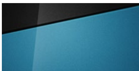
Aqua Turquoise (U3H - perłowy) Dostępny również z dachem w kolorze Phantom Black (5U3)