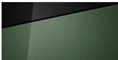
Mangrove Green (MG2 - metaliczny) Dostępny również z dachem w kolorze Phantom Black (5MG)