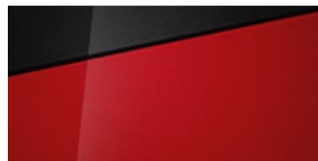
Dragon Red (WR7 - perłowy) Dostępny również z dachem w kolorze Phantom Black (5WR)